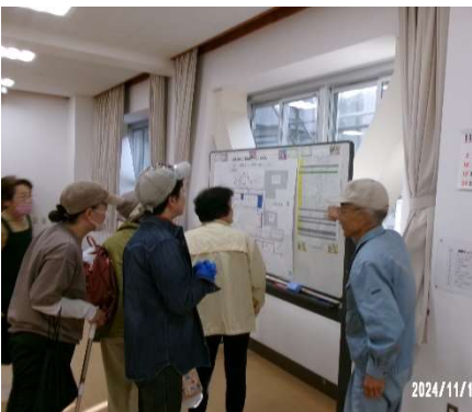
大ホールに貼り出された掃除箇所を確認してさあ～始まりです。

まずまずの天候の中、自主グループ、公民館に集う団体の方々、100名近くの皆さんにご参加いただきました。10時開始から1時間半であったという間に公民館の中はピッカピカ。ご協力ありがとうございました。