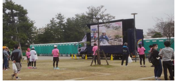
中央公園では桜マラソンを大型スクリーンで実況中