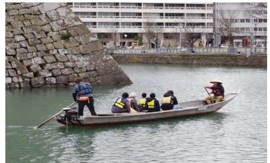
さくら祭りにはお堀の中に屋形船が遊覧

令和6年度も例年通りのスポーツ大会参加や交通安全教室、健康体操教室の開催に加えて「eスポーツ体験会」、「スマホ習熟講習会」なども取り入れて、高齢といえども現代社会に置いて行かれないように頑張らしましょう！