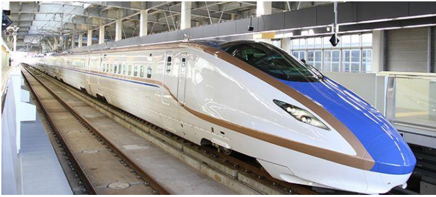
北陸新幹線 E7 系かがやき 東京～敦賀間を2時間51分