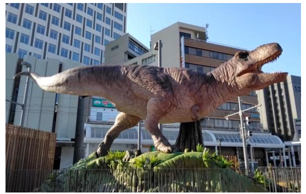
福井城址口ハピテラス前のティラノザウルス