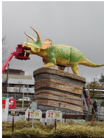
一乗谷口のトリケラトプス