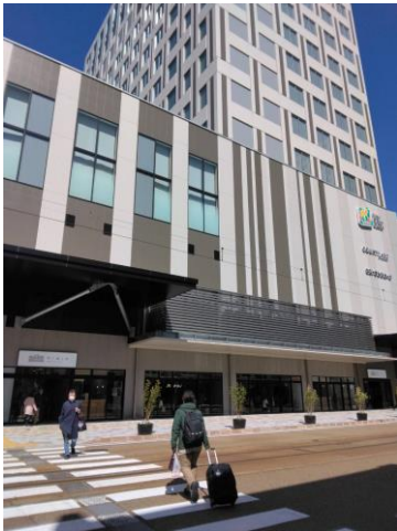
コートヤードホテルとミニエ