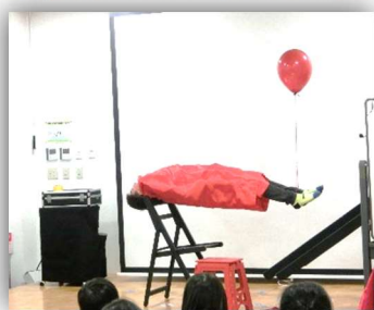
トランプを使ったマジック や、鳩が出てきたり・空中 に浮いたりで、 驚きの連続でした。