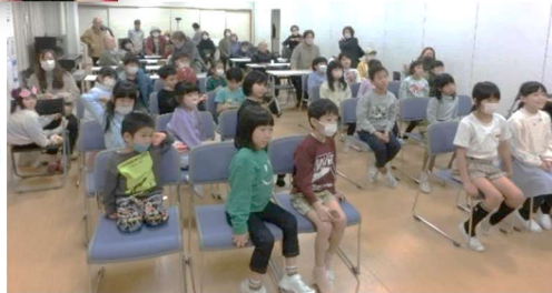
大勢の皆さんのご参加、 ありがとうございました。

自主グループ代表者会議のご案内 日時：3月6日(水) 14:00~ 場所：順化公民館 大ホール 対象者：自主グループ代表者の方 お願い：年に一度の大事な会議になります。 代表者のご都合がつかない場合は、代理の方(講師以外)が必ず出席下さい。 また、急な欠席の場合は、必ず公民館までご連絡をお願いします。