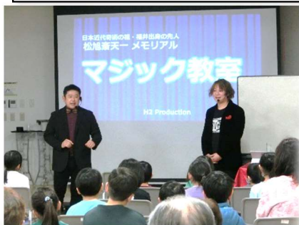
マジシャン ヘンリーさん マジシャン ハジメさん のお二人です。

順化福井学事業・順化放課後子ども教室共催 天一マジックショー・手品であそぼう が開催 されました。 2月21日(水) 15時~