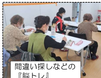
間違い探しなどの『脳トレ』