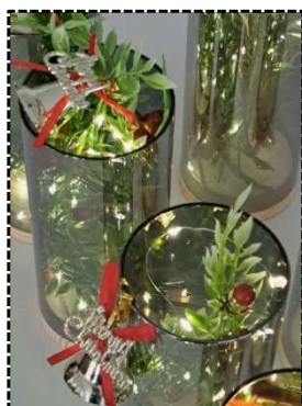
『創作』は… Xmasをイメージして

本日のデイホームのメニューは『創作』『輪投げ』『脳トレ』『手遊び』さらに『踊り』と盛りだくさん。生涯学習課からも職場体験の見学に。