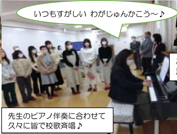
先生のピアノ伴奏に合わせて 久々に皆で校歌斉唱♪