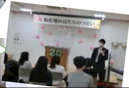
お一人お一人の先生から、皆さんへの 温かいおことばを頂きました