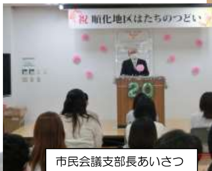
市民会議支部長あいさつ