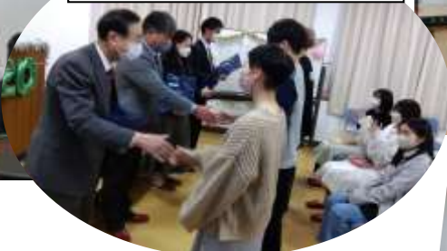
恩師へのプレゼント (写真立て&フォトクッキー)