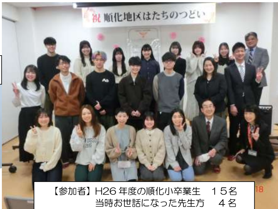
【参加者】H26年度の順化小卒業生 15名 当時お世話になった先生方 4名