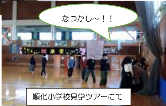
順化小学校見学ツアーにて